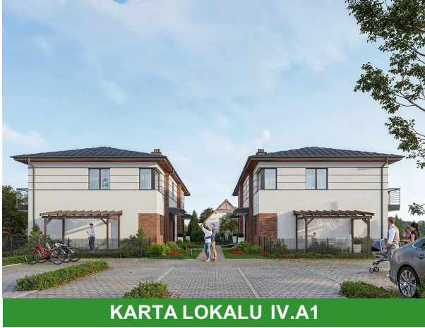
KARTA LOKALU IV.A1